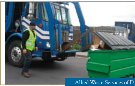
Allied Waste Services of Daly City

Presorted Standard U.S. Postage PAID San Mateo, CA Permit No. 610