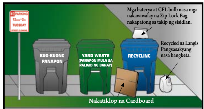
Nakatiklop na Cardboard

Huwag ilagay ang mga cart sa kalye sa mga panahong paglilinis na pinhahayag sa mga paskil. Maaring nagbabago ang mga panahon ayon sa route/araw.