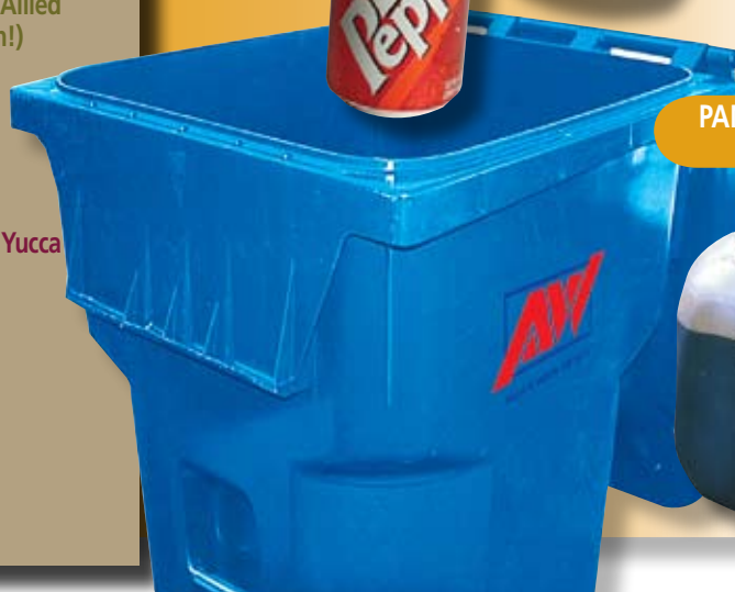
PANGOLEKTA NG LANGIS