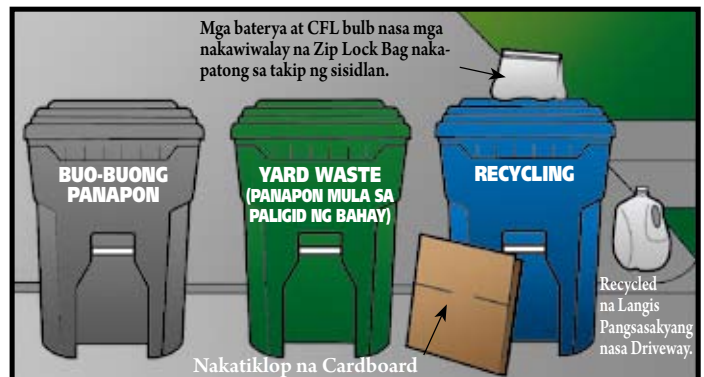
Nakatiklop na Cardboard