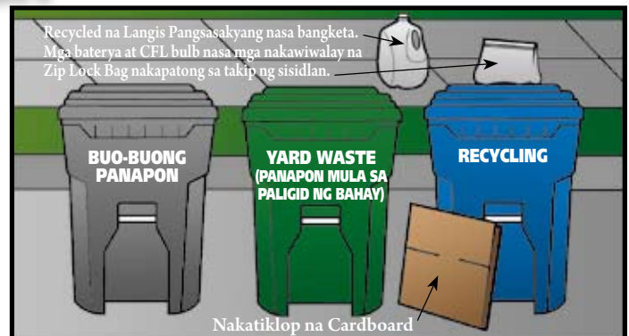
Nakatiklop na Cardboard