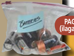
PAGTIPON NG BATERYA (ilagay sa ibabaw ng takip)

Hindi — Sanga ng Puno ng lampas sa 2" ang kapal